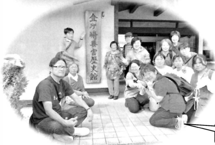
金ケ崎要害歴史館の前で記念撮影