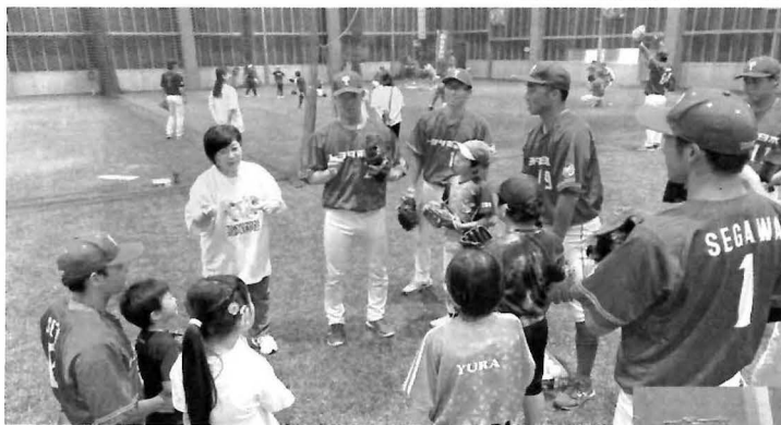
↗ 選手の皆さんとの交流