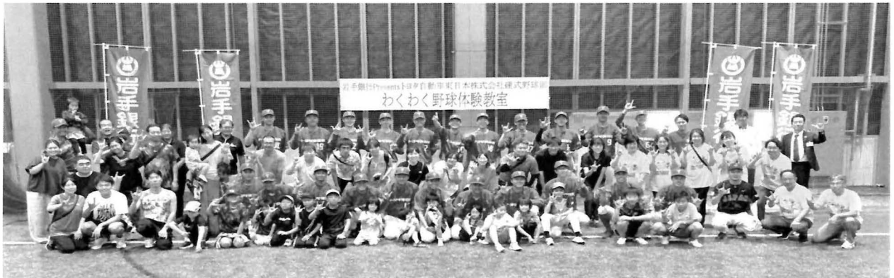
↗ 全員集合記念写真

「トヨタ自動車東日本株式会社(硬式野球部)」と「株式会社岩手銀行」が主催し、日本ろう野球協会と当協会が協力して野球体験教室が8月に開催されました。岩手銀行の方が何回も事務所に来所し打ち合わせしました。思った以上のたくさんの参加者が来てくれました。きこえない・きこえにくい子ども達が大喜びで元気いっぱい指導を受けていました。