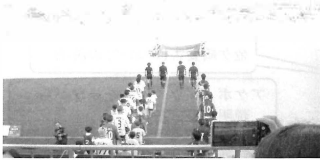
↑サッカー選手がきこえない・きこえにくい子どもたちと一緒にグラウンドに出場。保護者は大喜び。