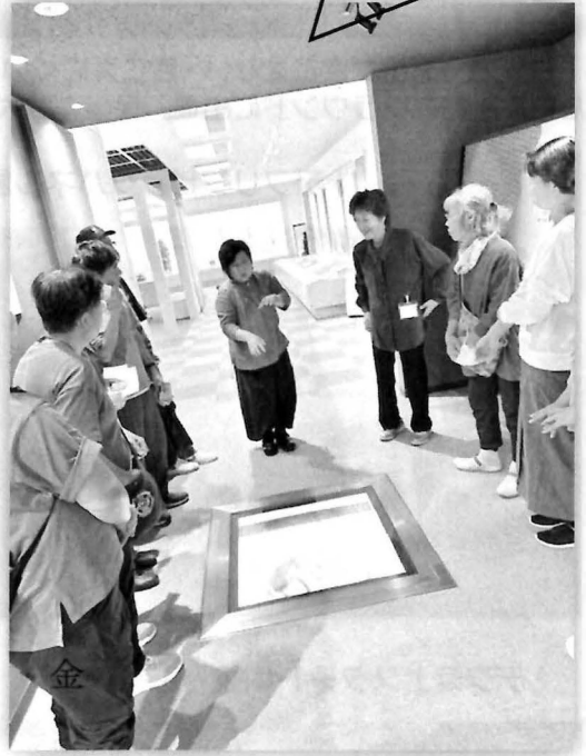
アケボノゾウの足跡を見ながら説明を受けてます