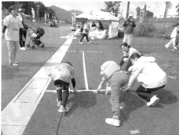
↓デフ陸上スタート体験