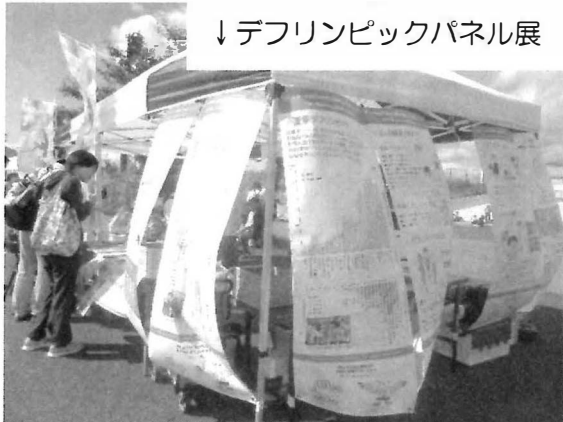
↓デフリンピックパネル展