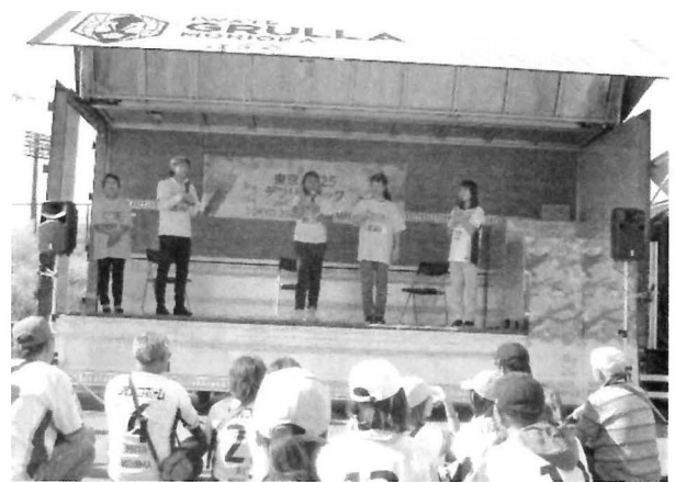
↓手話言語体験教室