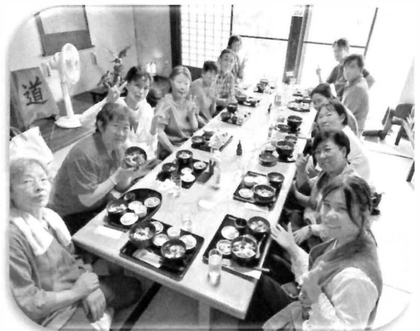
【和洋食道 Ecrú (エクリュ) にて】

私も金ケ崎に来て8年、伊達藩と南部藩の境目争いなど深い歴史があったことを知り勉強になったなあ。